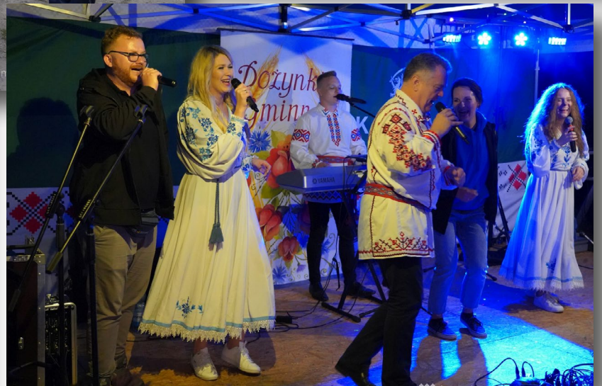
Zdjęcia z dożynek w Mieszce wykonała Dorota Sulżyk (Gminne Centrum Kultury w Gródku). Dziękujemy za udostępnienie