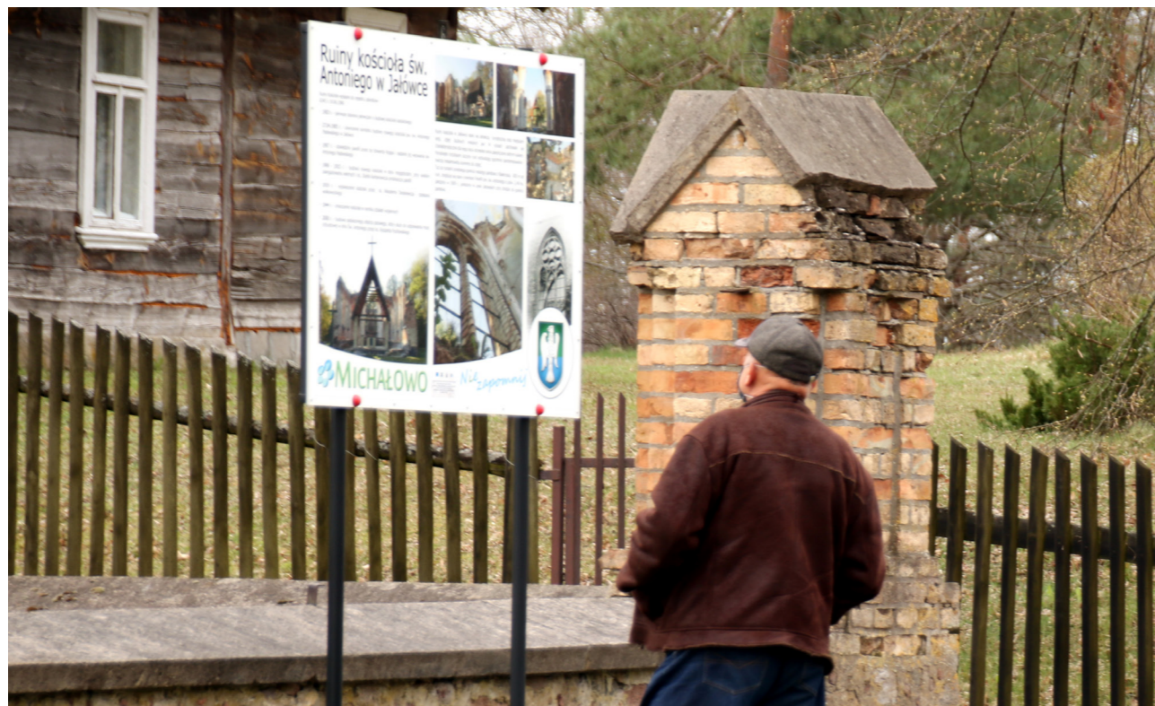
Jałówka ma bogatą historię

Szczegóły dotyczące wydarzeń pojawią się na facebookowym profilu Stowarzyszenia Miłośników Jałówki i okolic. (PS)