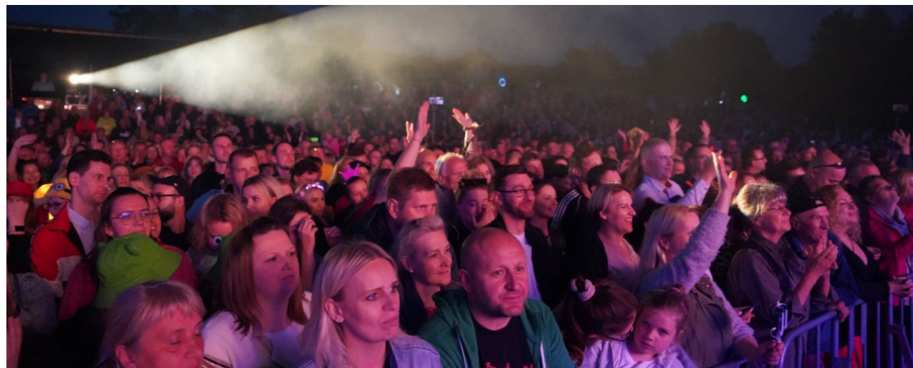
Uroczysta prezentacja Kantyków w kościele NMP Królowej Polski w Supraślu 19 czerwca 2022 r.