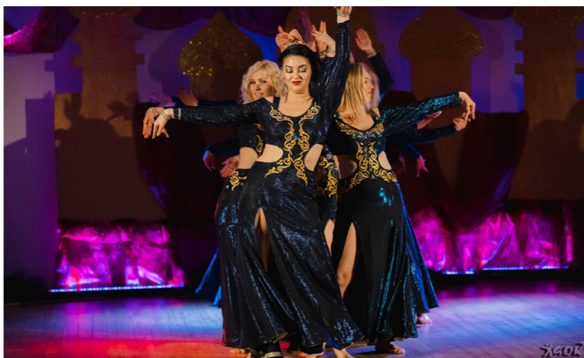
Oriental Dance Show

Kolejne atrakcje szykowane są przez całe wakacje, więc mieszkańcy i turyści nie będą narzekać na nudę. Pierwszym punktem na letniej mapie imprez są Dni Michałowa 2023. To coroczne