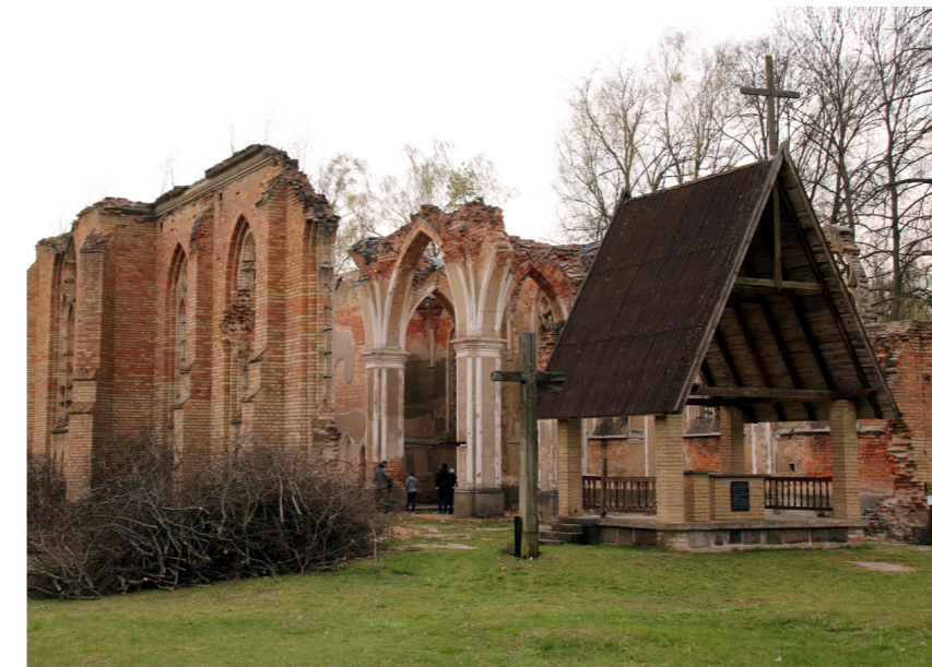
Dotychczasowy daszek jest już w złym stanie

Powstanie nowy daszek kaplicy p.w. św. Antoniego w Jałówce. Radni Michałowa jednogłośnie przyjęli uchwałę w tej sprawie. Samorząd przekaże 45 tys. zł dotacji parafii Rzymskokatolickiej p.w. Przemienienia Pańskiego na ten cel.