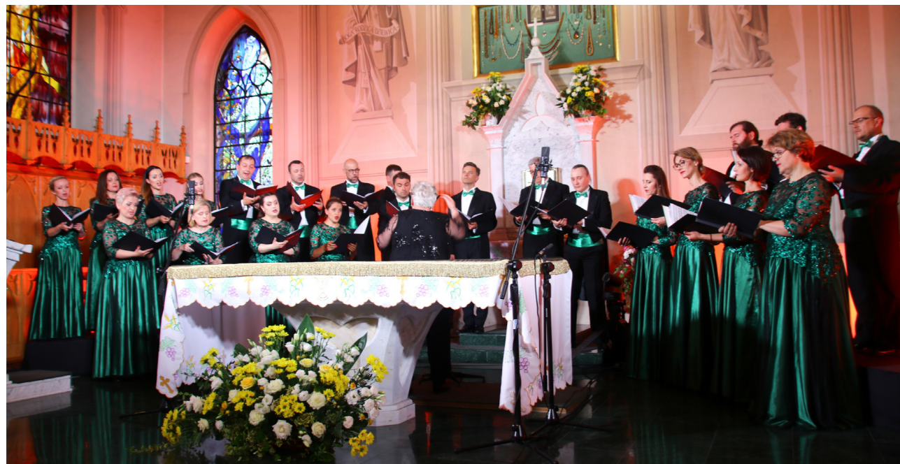
Uroczysta prezentacja Kantyków w kościele NMP Królowej Polski w Supraślu 19 czerwca 2022 r.

– Bardzo się cieszę, że Kantyki Supraskie zostały nominowane do Fryderyków, czyli wyróżnienia przyznawanego przez polskie środowisko muzyczne za najważniejsze osiągnięcia na rynku fonograficznym w Polsce. A wygrana cieszy jeszcze bardziej. Mam nadzieję, że Kantyki Supraskie rozstawią całe Podlasie, a nawet zdobędą popularność, ponieważ te niemal 50 odkrytych utworów barokowych to prawdziwy